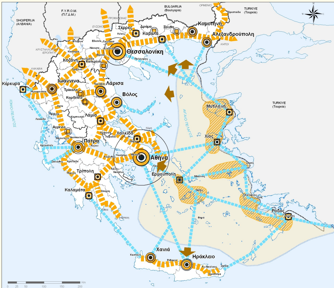
Χάρτης 5: Πύλες - Πόλοι και Άξονες Ανάπτυξης